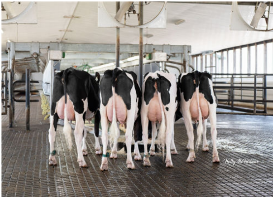
STANTONS GALORE GROUP L-R STANTONS GALORE BEQUITA, SABLE, CREAM AND EVIE