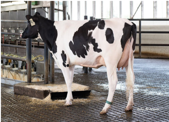
STANTONS GALORE CREAM